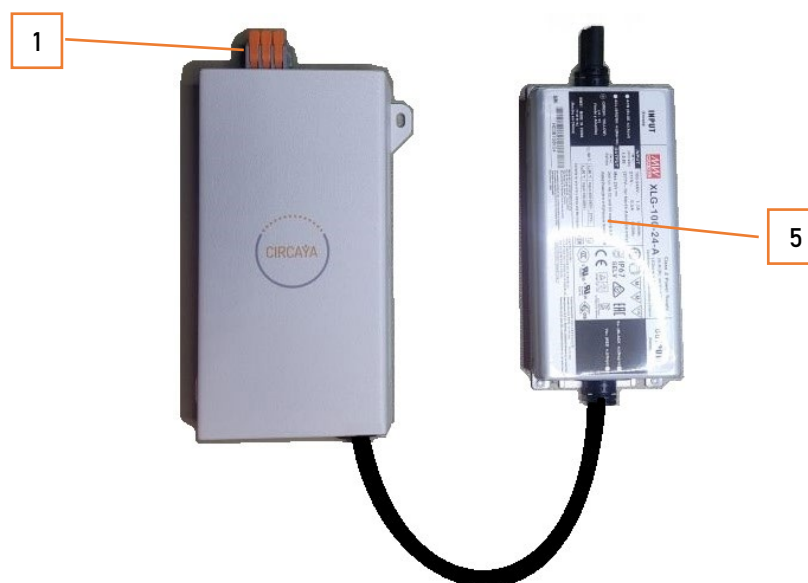
INTOBOX avec son Alimentation externe (Version INTOBOX 1D)

Conçu pour être posé ou fixé dans un faux-plafond, des oreilles permettent de fixer le boîtier, et des ouvertures permettent de faire passer les cordons de l'alimentation externe, et de la télécommande filaire le cas échéant.